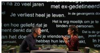
Zomergasten: Griet Op de Beeck In deze documentaire van Nic Balthazar en Alexander van Vliet vertellen 12 gevangenen uit de gevangenis in Oudenaarde hun verhaal. De gevangenen zijn onherkenbaar in beeld gebracht. De documentaire Binneninzicht is tot stand.